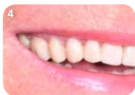
Takk til Tnl. C. Lampson, Tyskland