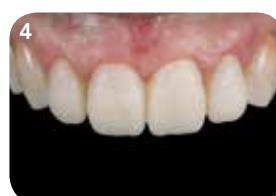
Takk til Tnl. J. Tapia Guadix, Spania